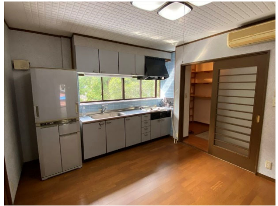
D.K. (別棟 2階)