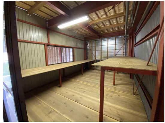
事務スペース（別棟 中2階）