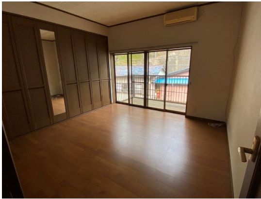
洋室 (別棟 2階)