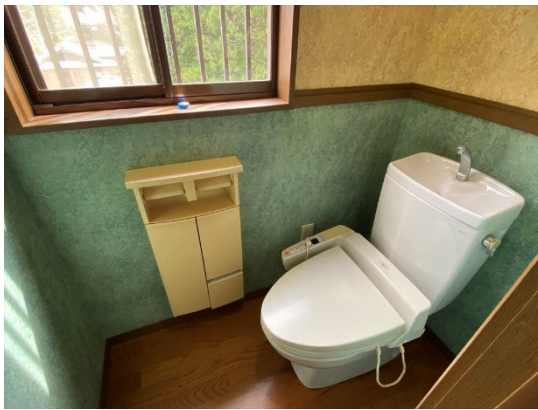
トイレ (別棟 2階)