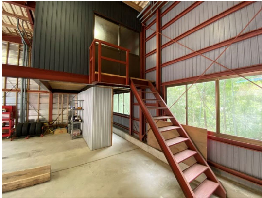
ガレージ (別棟 1階)