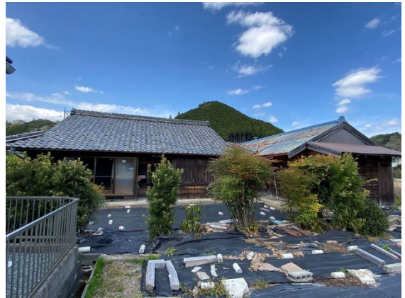
外観（敷地南側の農道）