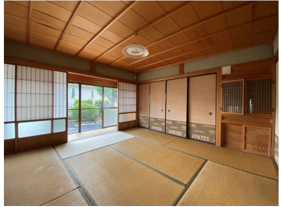
和室 8 帖