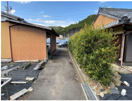
外観（主屋と倉庫①との間の道）