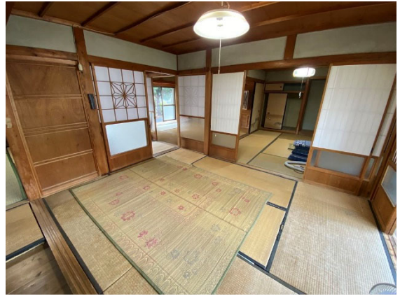
和室 6 帖